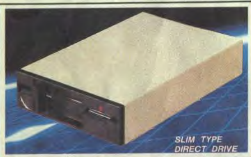
SLIM TYPE DIRECT DRIVE