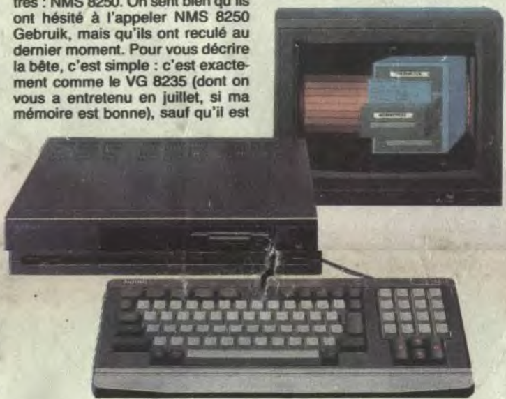
Le Philips qui veut se faire aussi gros que le PC.

tié de chaînes hifi, pour un tiers de PCW 8512 et 8256 et pour le sixième restant de 6128. Pas de 464, on s'y attendait un peu, mais surtout, pas de PC et pas de Sinclair... Bon, le PC, bien qu'Amstrad ait invité tous les journalistes français en Angleterre pour sa présentation sauf nous, on a tout eu. Mais comme il y en a beaucoup à dire, on se le garde pour la semaine prochaine. Et puis comme ça, vous êtes obligés d'acheter le prochain numéro et ça nous fait toujours 11 balles dans les fouilles. Par contre, le Sinclair Spectrum 2+... Il est là, mais pas chez Amstrad. Il est chez Eltek, qui est l'importateur au Bénélux d'Amstrad. Pas de Schneider, hein, juste les chaînes hifi Amstrad et le Sinclair. Bon, vous avez une photo, quelque part. Regardez et revenez. Il a le look Amstrad, et le look Sinclair. C'est un hybride (au Firato, on